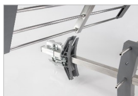
Système CLIC CLAC Montage facile

Dipôle clipable sur la structure Clip renforcé pour une meilleur tenue